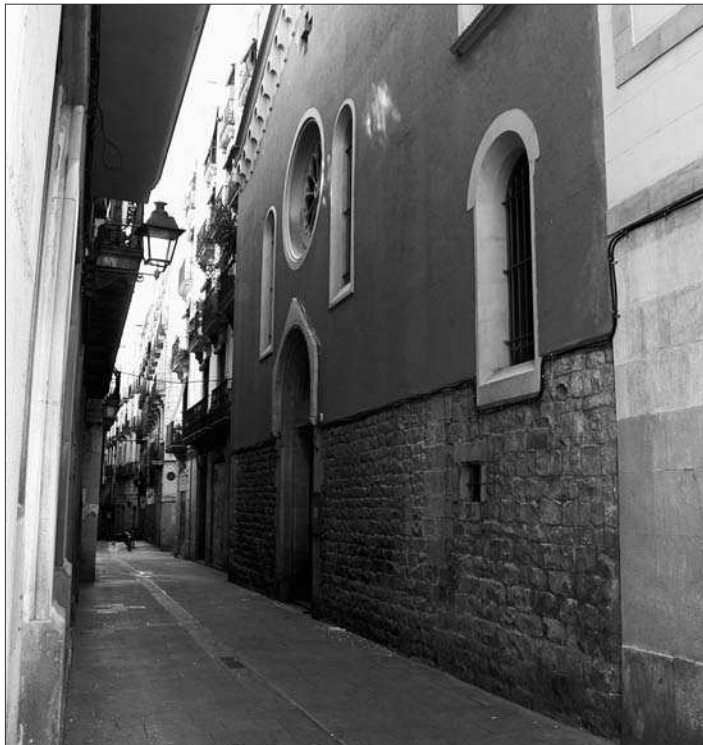
Façana de la capella del convent del Temple (des del carrer d'Atarés). Malgrat que alguns elements de la portalada són d'època templera, el conjunt és resultat d'una remodelació de mitjan segle XIX.

Una pintura de 1858 ens mostra la Sala dels Cavalls amb una coberta plana de fusta, recolzada sobre tres grans arcs diafragmàtics, mentre que un dibuix del mateix any ens en mostra la planta baixa amb coberta de voltes de creueria.