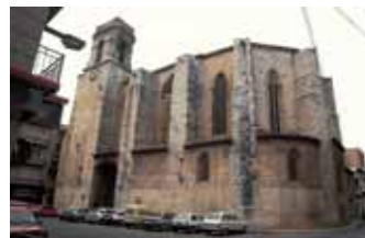
Església de Sant Lluç, a Ulldecona.

Des d'aquests abrics podem imaginar aquells habitants prehistòrics dominant la vall a recer de les feres i dels enemics, preparant les jornades de caça, invocant els esperits benefactors de la cacera i pintant les figures a les parets rocalloses d'aquesta serra.