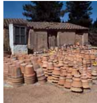
Terrissa de la Galera.

• El castell d'Ulldecona és un recinte emmurallat dalt d'un turó, amb quatre portes d'accés. A dins hi ha la torre-palau dels Hospitalers, una torre quadrada amb dos pisos grans i tres finestres, i les restes d'una torre cilíndrica d'uns cinc metres de diàmetre i deu d'alçària.