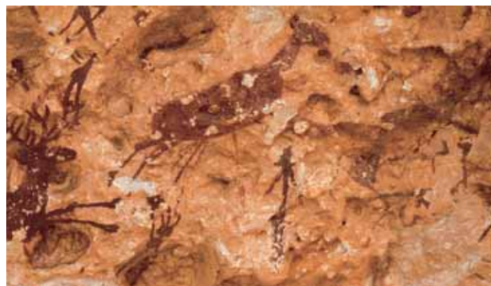
Pintures rupestres d'una escena de caça.

L'accés a l'ermita es fa per una carretera asfaltada que va pujant entre xiprers i capelletes del calvari. Quan arribem a dalt de tot, ens trobarem amb una plaça exterior que fa de balconada a la plana i a la serra del Montsià.