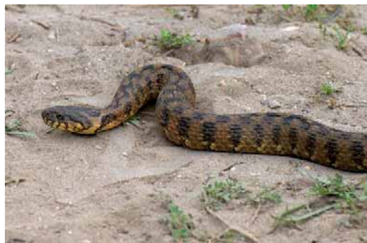
Formosa serp d'aigua escurçonera ( Natrix maura )

La Punta de la Banya, with its white salt-works and coloured heaters, surfaces where salt is extracted and where one of the most emblematic bird in our Delta usually breeds, the Flamingo. Here also more than half of the world population of a gull called Corsican breeds, which is grey and white and has got a distinctive red peak. There are also coastal saline lagoons, full of fish, surrounded with