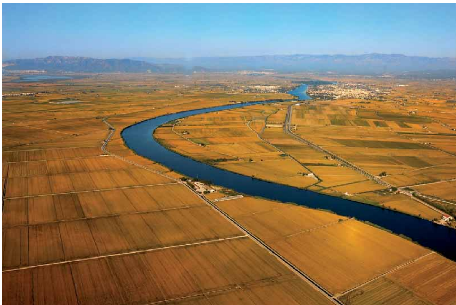
L'Ebre, curial de mena, solca entremig de pobles i arrossars generosos El Ebro, curial por naturaleza, surca en medio de pueblos y arrozales generosos The river Ebro goes through villages and generous paddies