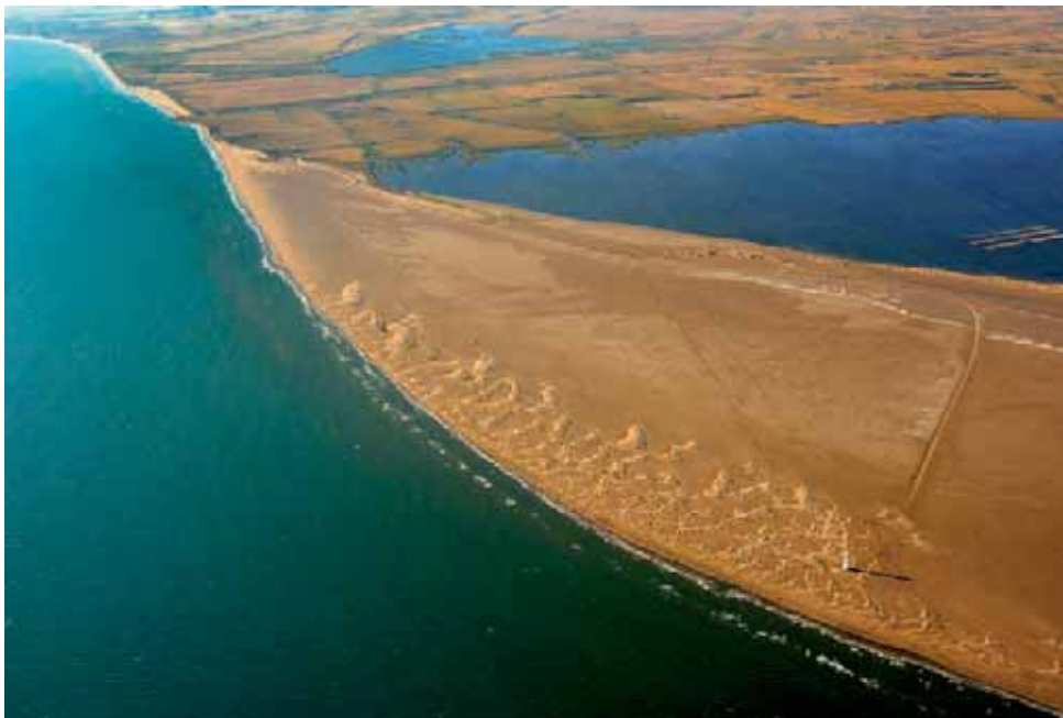
Platja miraculosa; dunes, castells vivents!; far, vigia!, al Fangar! Playa milagrosa; ¡dunas, castillos vivientes!; ¡faro, vigía!, en El Fangar Miraculous beach; Dunes and living castles!; lighthouse, watchtower!, in El Fangar

When water has already covered the Delta, rice is sown, the main crop. After two weeks, you can already see it like a little flag. The clear water turns into green and the ducklings and the young common moorhen can be seen behind their mothers in the fields. Rice grows and the green colour gets everywhere. It's already hot!!! When the rice plant is growing, later gleaning, everything stagnates. Time passes slowly. But at the end of summer, your heart softens with the gilded fields and you breathe the intense smell of grain spike all the time, and everywhere is yellow. You experience the farmer's anxiety.