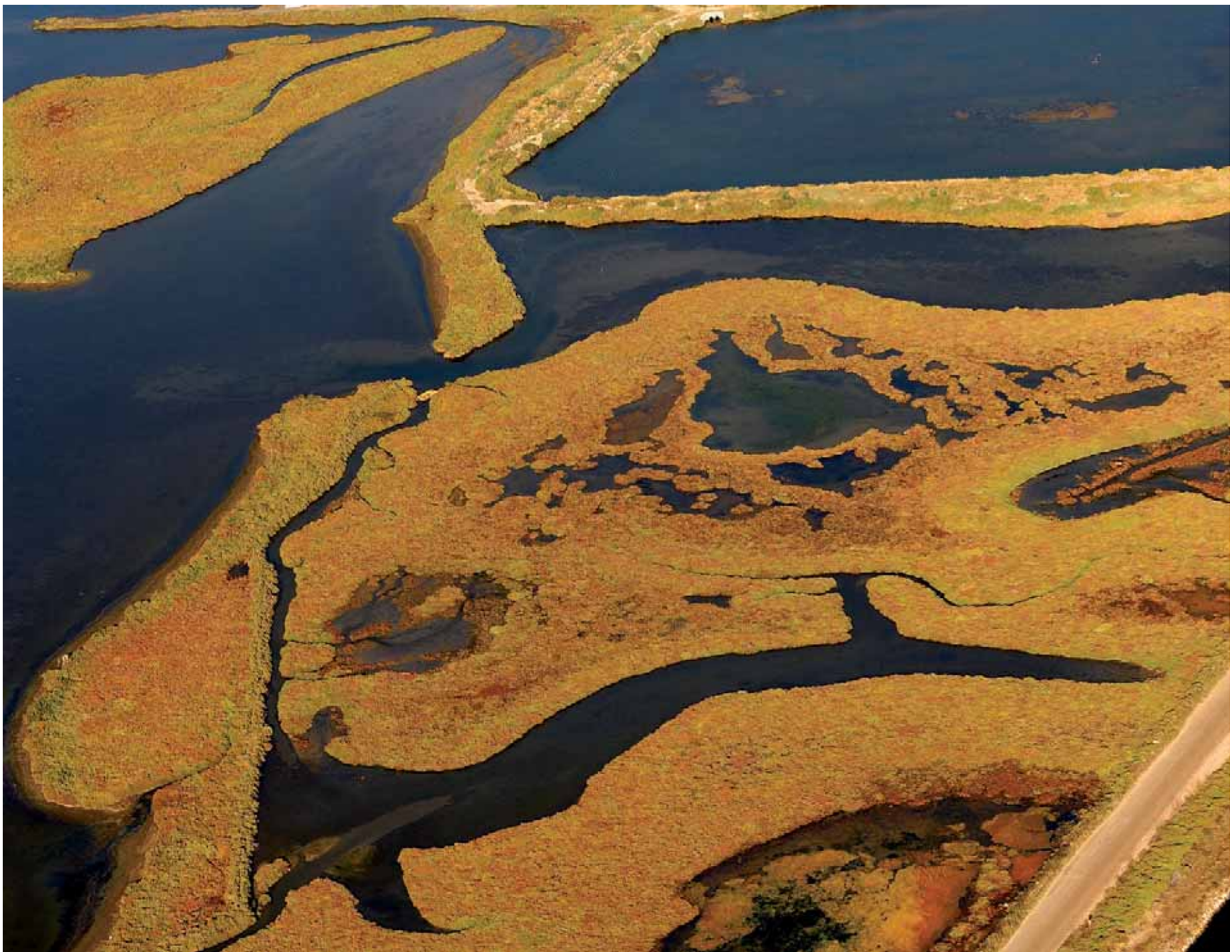
Dibuixos capritxosos, vora la badia dels Alfacs Dibujos caprichosos, junto a la bahía de Los Alfacs Capricious drawings, close to the bay Els Alfacs